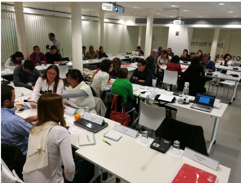
Trabajo en grupos