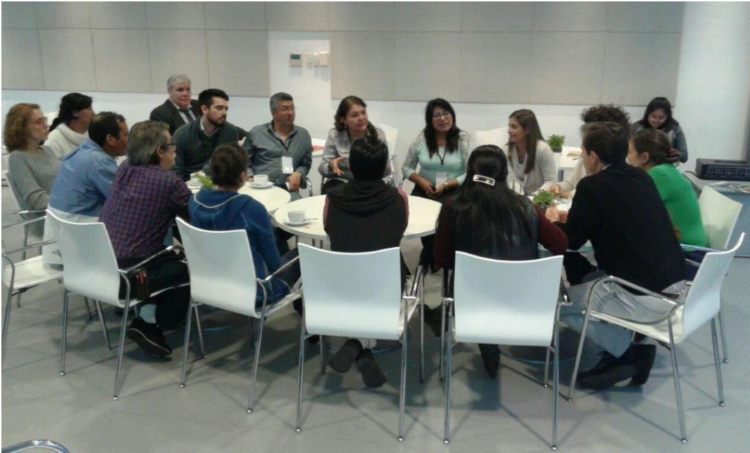
Trabajo en grupos