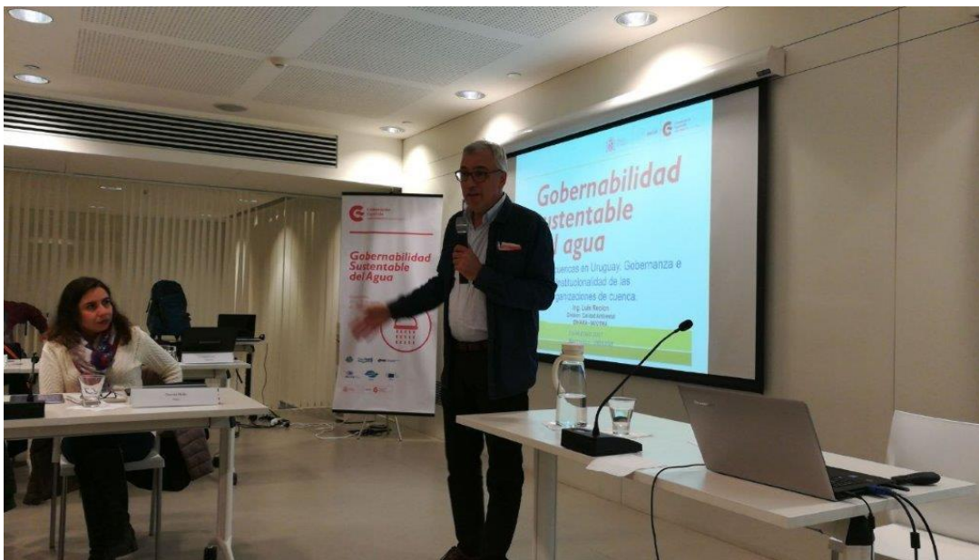
Luis Reolón, Dirección Nacional de Aguas de Uruguay