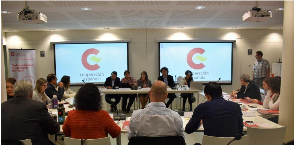
Apertura del curso