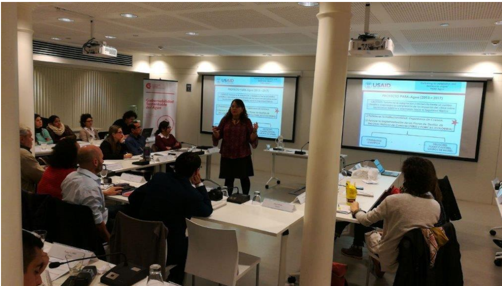
Presentación de los participantes