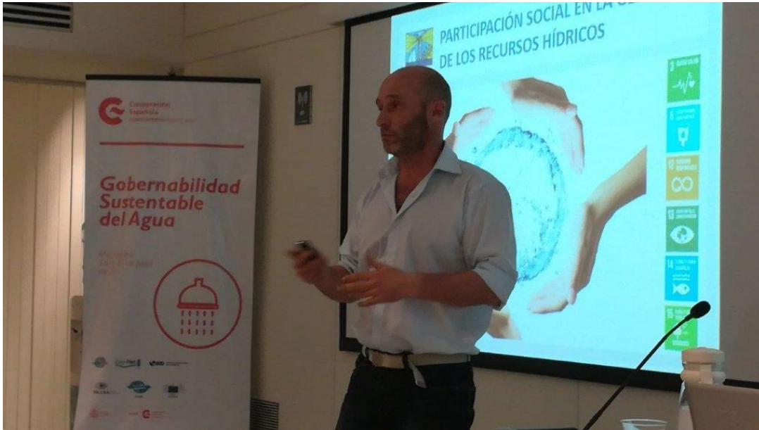
Presentación de los participantes