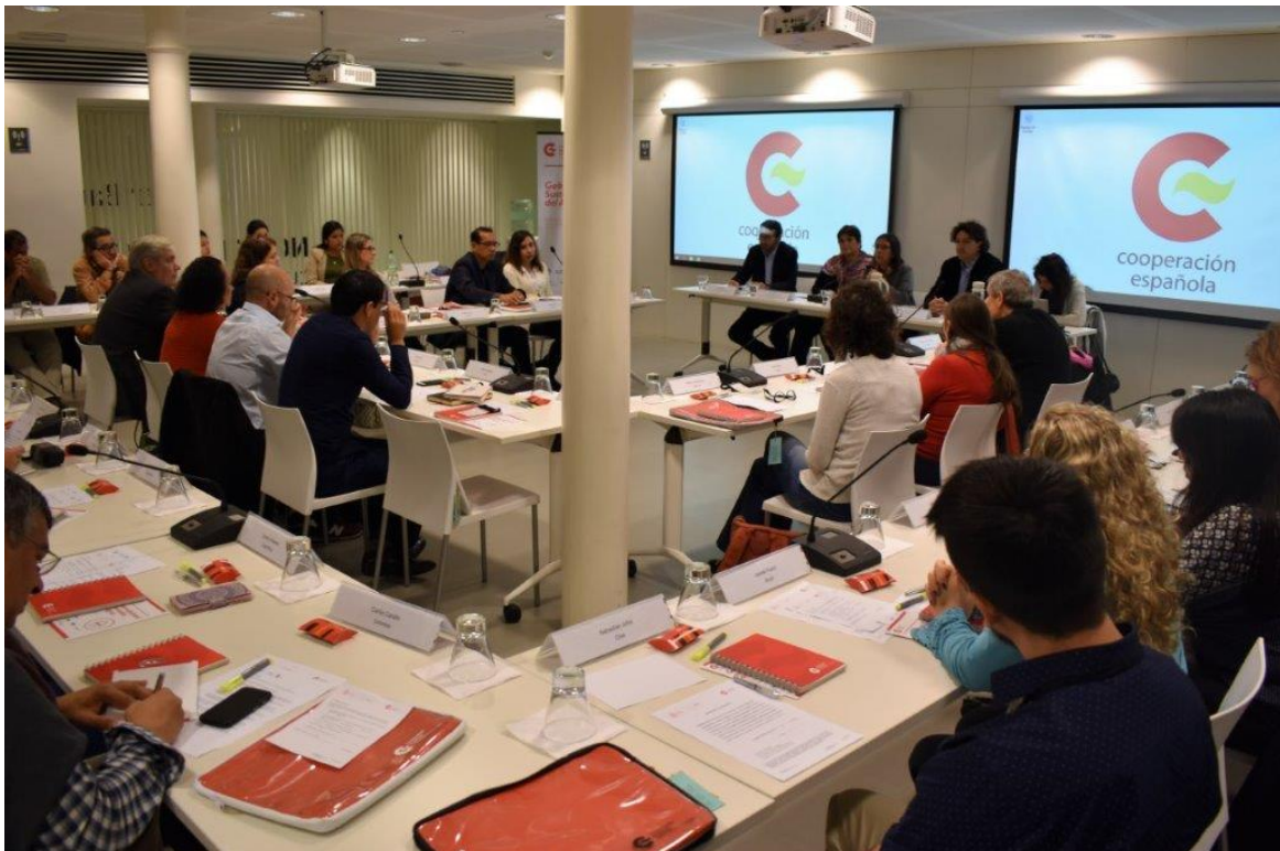
Vista del curso